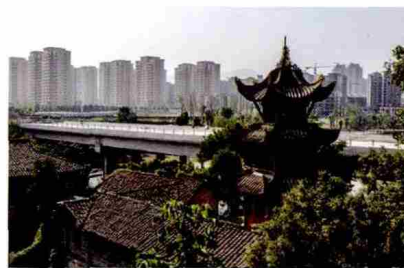
图 2 海鹤书院