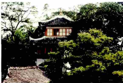
图 1 维修前 (左) 后 (右) 的凌云书院诏书阁