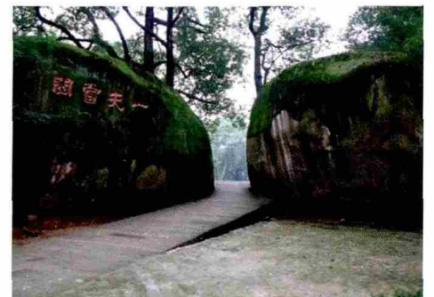
图 4 聚奎书院建筑及于佑任题刻碑