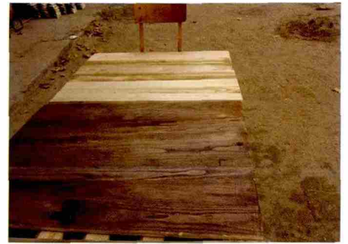
图 14 统色中的补配天花