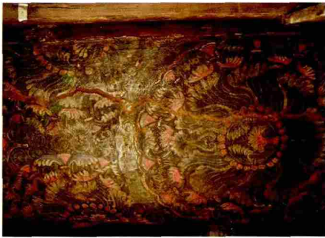
图 12 明东次间大梁开裂地帐修复