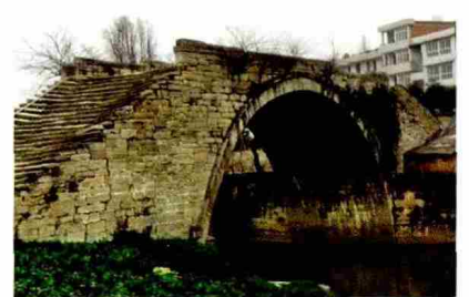
图 3 海鹤书院旁的龙济桥