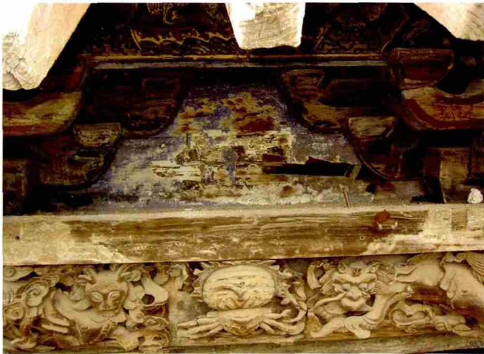
图 15 外檐中部拱垫板主题彩画原状