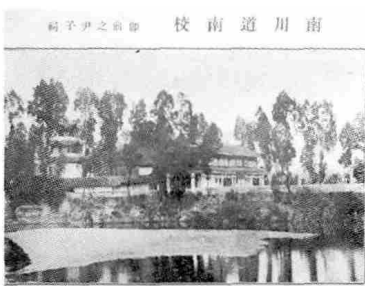
图1 民国《南川县志》上的尹子祠旧照

市级文物保护单位，是市级风景名胜区。书院“风物佳丽，全蜀学校不及”。佛学大师欧阳渐高度概括了书院人文与生态环境，题联赞誉“是英雄铸造之地，为山川灵秀所锤”。聚奎书院为我市目前保存最