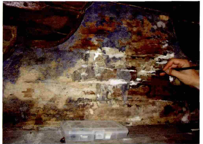
图 16 外檐中部拱垫板主题彩画地帐补全