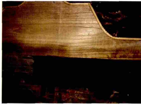
图 13 过火木材强化