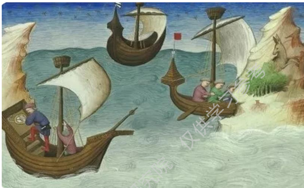
图 40 约翰·曼德维尔的游记 选自《世界奇迹之书》 1410-1412 年 法国巴黎国家图书馆藏