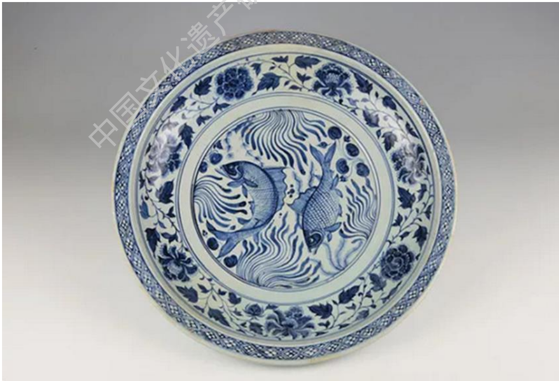
图 43 青花莲池鱼藻纹盘 元 湖南省博物馆藏