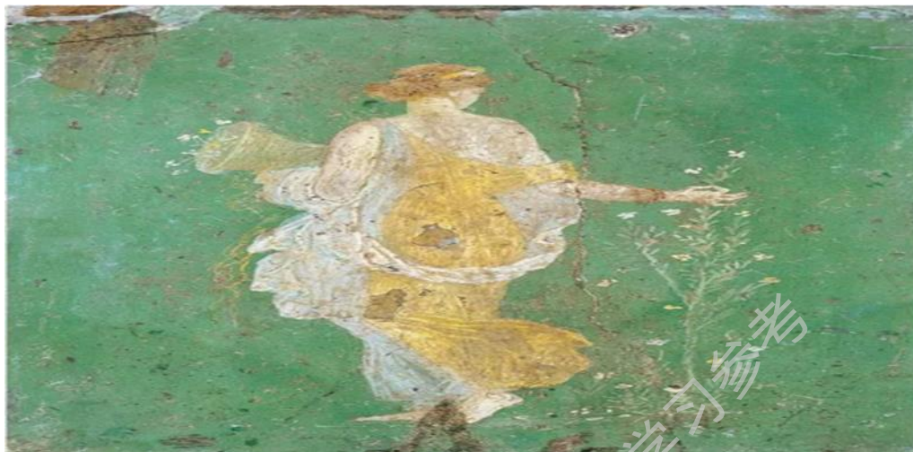
图 38 花神芙罗拉 庞贝壁画 1 世纪意大利那不勒斯国家考古博物馆藏

了延续系列讲座的主题，展示文化遗产保护与研究的最新成果，并促进两家机构的交流与合作，中国文化遗产研究院中国世界文化遗产中心特别邀请李军教授分享他的跨文化美术史研究，并介绍“在最遥远的地方寻找故乡”展览的策划。