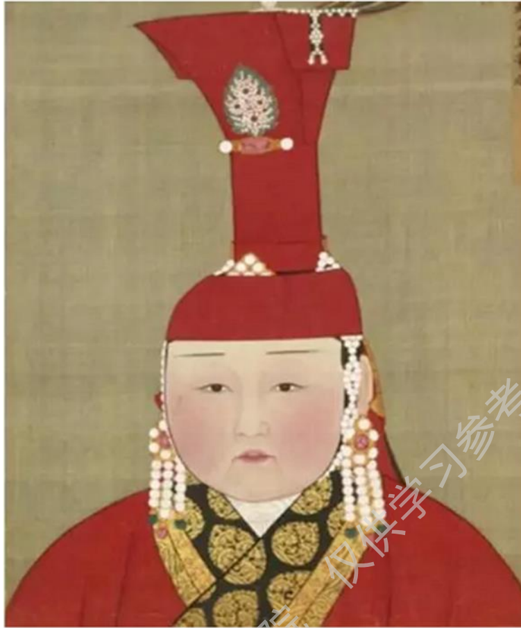
图 42 武宗皇帝后 元 台北故宫博物院藏