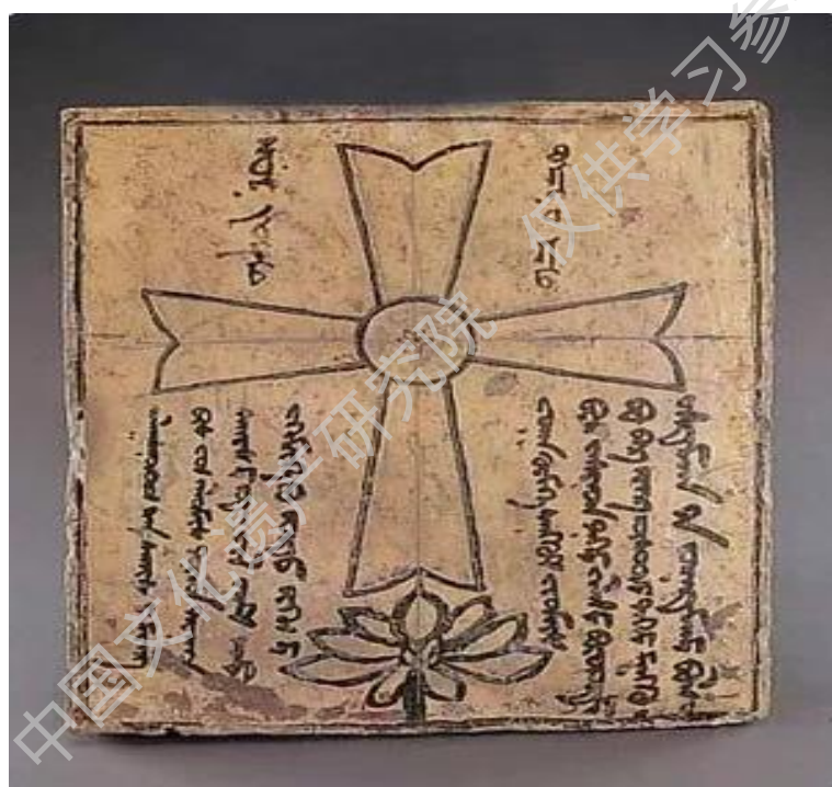
图 46 景教瓷墓志 元 内蒙古自治区赤峰市松山区文物管理所藏

作为对第四单元的呼应，第五单元“来而不往非礼也”主要关注中、意文化交流在中国本土留下的痕迹，以及对中国文化产生的影响。整个部分主要展现的是西方的“天马”在古代书画中的身影、中国境内的景教遗存和受到“圣母子”图像影响的送子观音像，并以明清两朝的“西学东渐”作为结尾。几百年间中西方文化交流的成果，正如利玛窦绘制的《两仪玄览图》一样，深刻地塑造了现代人的世界观。