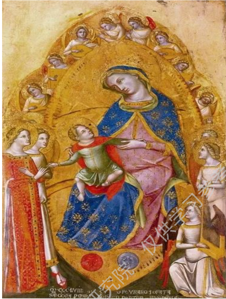
图 44 圣凯瑟琳的神秘婚姻 洛伦佐·韦内齐亚诺 1360年 意大利威尼斯学院美术馆藏