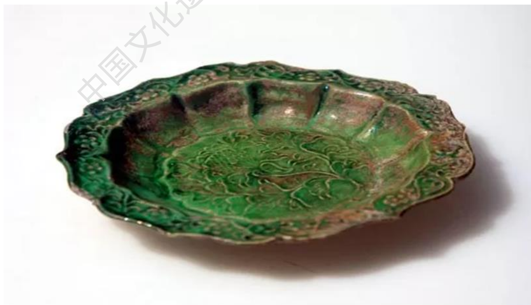
图 41 磁灶窑绿釉印花花卉纹碟“南海一号”沉船出水 南宋 广东海上丝绸之路博物馆藏