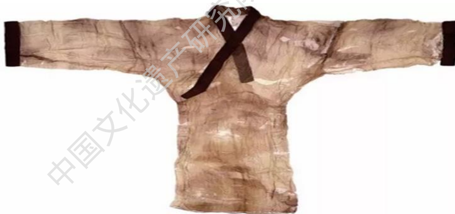
图 39 素纱单衣 马王堆汉墓出土 西汉 湖南省博物馆藏

李军教授 1987 年毕业于北京大学哲学系，1996 至 1997、2002 至 2004 年、2011 至 2012 年和 2013 年，分别在巴黎国际艺术城、法国国家遗产学院、巴黎第一大学、哈佛大学本部和哈佛大学佛罗伦萨文艺复兴研究中心，从事文化遗产和跨文化、跨媒介艺术史研究，2014 年任意大利博洛尼亚大学客座教授。开设“文化遗产概论”、“跨文化美术史研究”等课程，出版《穿越理论与历史：李军